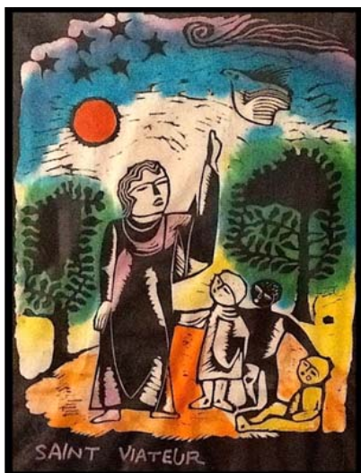
Sadao Watanabe, Japon, 1972