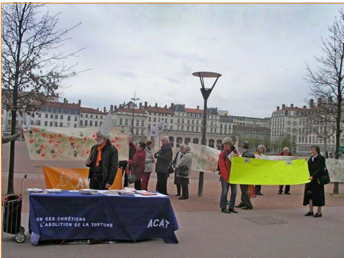
11 de abril 2013 : Manifestación frente al consulado de Méjico en Lyon contra "ARRAIGO". (Medida del gobierno mejicano que legitima la tortura durante la detención policial)

Esto es lo que vivo cotidianamente... Todo ello me conduce a una conversión en mi manera de ser y de actuar dando pequeños pasos, primicias de una larga marcha hacia la construcción de un mundo digno.